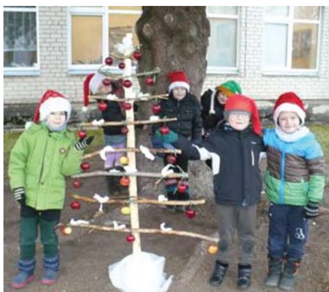
Trečioji vieta ir laikraščio „Anykšta“ prenumerata trims mėnesiams skiriama Anykščių vaikų lopšelio – darželio „Žiogelis“ bendruomenei.