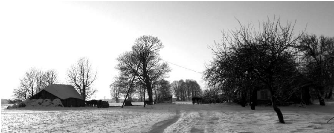
Teigiama, kad šaltis nepavojingas ne tik veisliniams, bet ir paprastiems galvijams