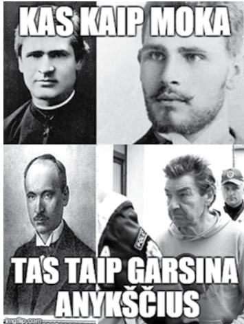
„Anykščių pliotkai, negandos ir likusios 24 valandos nuo Untanio iki Marytės“, - taip savo apžvalgas feisbuke pristato „Anykščių trolis“.

Valdžia svarsto apmokestinti stovėjimą prie „Puntuko“ viešbučio. Ką apie tai mano pasaulis?, - klausia pramanytas personažas „Anykščių trolis“ ir pats pateikia atsakymus.